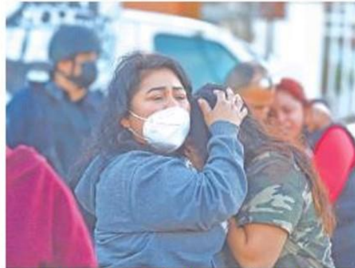
Familiares de personas privadas de la libertad en el Cereso de Mexicali se mostraron angustiados por la situación ocurrida dentro del penal.

Entre disparos y estallidos elementos de la Penitenciaría sofocaron motín en el Cereso, familiares de internos se movilizaron en el exterior de la cárcel, donde tuvieron enfrentamientos con policías.